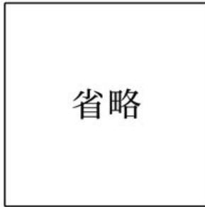
図2 城柵(徳丹城 とくだん )